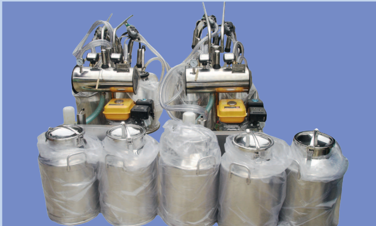
Ang ilan sa mga milking machine na ipinamahagi ng Department of Trade and Industry (DTI) sa mga magsasakang-maggagatas sa Nueva Ecija.

Ang mga magsasaka-katiwala ng 11 kooperatiba, na nakatanggap ng shared service facility (SSF) mula sa Department of Trade and Industry (DTI), ay nagkaroon kamakailan ng pangkalahatang pagpupulong sa Philippine Carabao Center (PCC) National Headquarters and Gene Pool sa Science City of Muñoz, Nueva Ecija upang talakayin ang iba't-ibang mga bagay na kaugnay sa nasabing pasilidad.