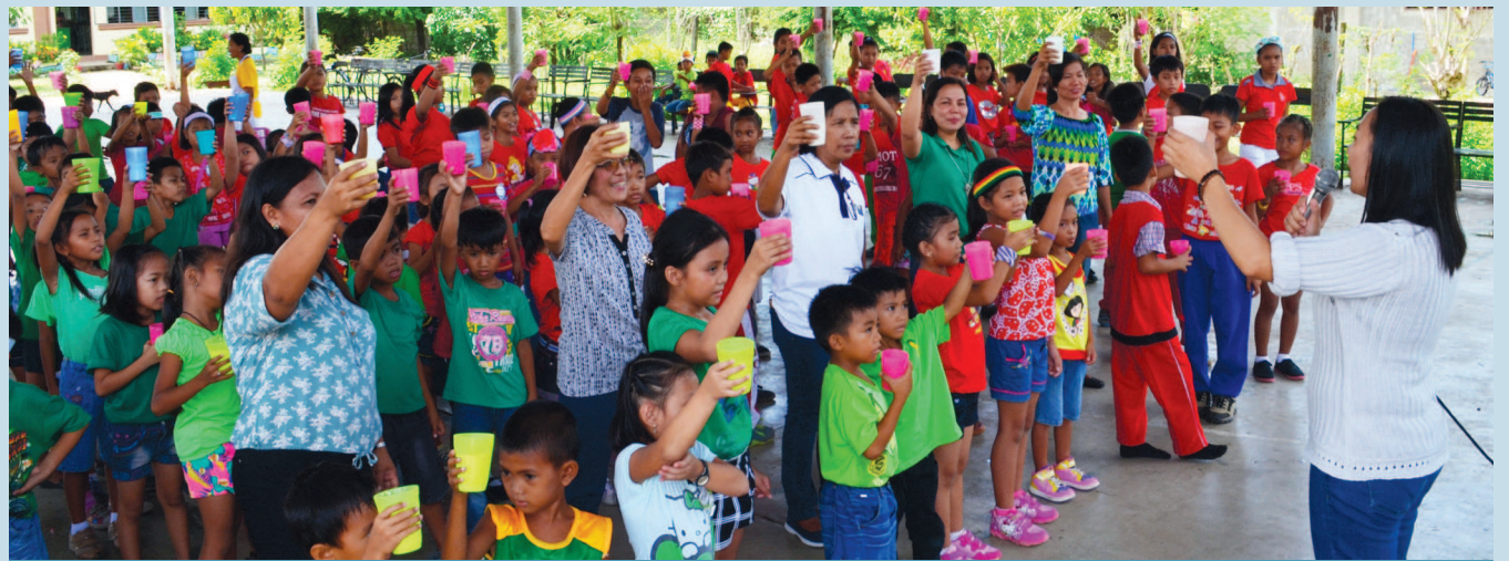
Ang ilan sa mga batang mag-aaral mula sa Licaong Elementary School kasama ang ilang kawani ng PCC at iba pang kabalikat na grupo ng ahensiya habang isinasagawa ang seremonya ng ‘tagay-pugay’. Parte ng aktibidad na ito ang isinagawang paglulunsad ng nasabing mga grupo sa programa na milk feeding na tatagal ng 120-araw sa Muñoz.

nagsagawa ng “Milk Pasteurization Training” para sa mga opisyaes at miyembro ng PTA sa nasabing paaralan upang linangin ang kanilang kaalaman sa tamang pagpoproseso at kaukulang pagmamantine ng kalinisan ng gatas.