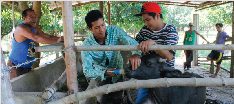
Ang ilan sa mga magsasakang kalahok sa isinagawang “Animal Health Care and Management Training” nitong Agosto 3-5 habang nagpupurga ng kalabaw.

Tinuruan ng pagbibigay ng mga pangunang-lunas sa mga sakit ng kalabaw ang piling mga magsasaka sa isinagawang “Animal Health Care and Management Training” noong Agosto 3-5 ng PCC.