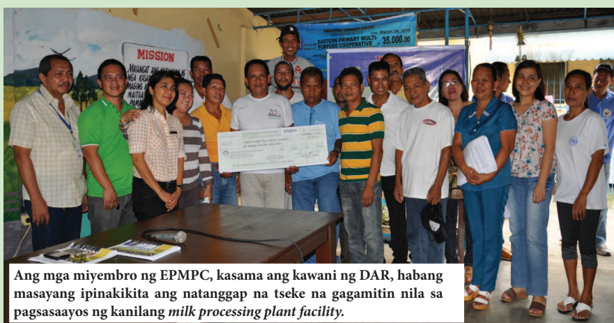
Ang mga miyembro ng EPMPC, kasama ang kawani ng DAR, habang masayang ipinakikita ang natanggap na tseke na gagamitin nila sa pagsasaayos ng kanilang milk processing plant facility .

Nakatakdang ipaayos ng Eastern Primary Multi-Purpose Cooperative (EPMPC) ang milk processing plant nito matapos itong makatanggap ng pondong nagkakahalaga ng Php100,000 mula sa Department of Agrarian Reform (DAR) sa pamamagitan ng Program Beneficiaries Development (PBD) nito.