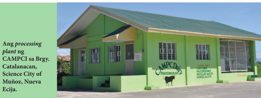
Ang processing plant ng CAMPCL sa Brgy. Catalanacan, Science City of Muñoz, Nueva Ecija.

Idinugtong niya na sa susunod na pasukan, aabot sa 500 pakete ng chocomilk, ang kanilang ipinoproceso at ipinagbibili mula sa regular nitong 150 pakete ngayon.